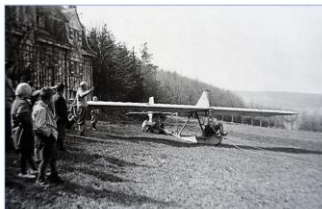
Segelflieger beim Kögerl