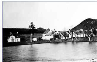
Teich neben der Bäckerei Muck (spätere Muckwiese)