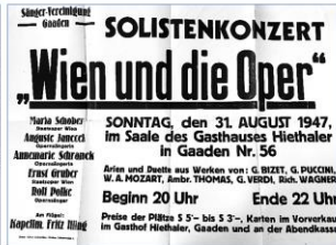
Ankündigungsplakat der Sängervereinigung Gaaden