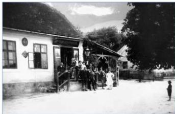
In dieser Veranda probte seinerzeit der Kirchenchor