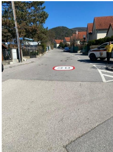
Verkehrsberuhigende Maßnahme Berggasse/Böhnelstraße