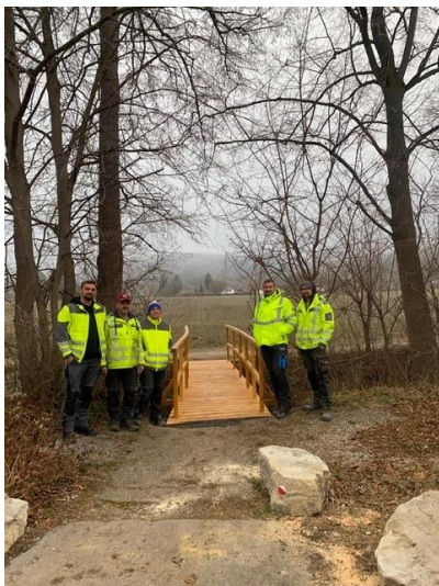
Die beschädigte Brücke über den Schneiderbach wurde instandgesetzt