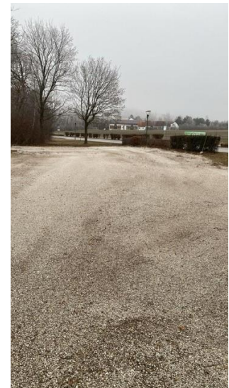
Der Parkplatz gegenüber dem Friedhof wurde saniert